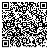
Canal de denuncias Grupo GHENOVA

El Grupo GHENOVA dispone de un canal de denuncias que permite la puesta en conocimiento del Comité Ético y de Conducta, de manera confidencial, de las presuntas infracciones del Código, así como de la posible comisión de irregularidades de naturaleza financiera y/o contable o la realización de cualesquiera otras actividades irregulares o fraudulentas en el seno de la organización.