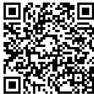
Canal de denuncias Grupo GHENOVA

El Grupo GHENOVA dispone de un canal de denuncias que permite la puesta en conocimiento del Comité Ético y de Conducta, de manera confidencial, de las presuntas infracciones del Código, así como de la posible comisión de irregularidades de naturaleza financiera y/o contable o la realización de cualesquiera otras actividades irregulares o fraudulentas en el seno de la organización.